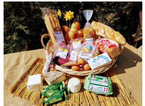
PANIER N°3 (5 à 6 personnes : 60€)

Ces offres pourront s'étoffer dans le temps en fonction des productions locales disponibles et des attentes des consommateurs.