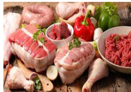
MAURIENNE VIANDE & SALAISONS — HERMILLON