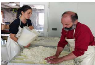
GAEC MELQUIOT CHÈVRE & BREBIS — SOLLIÈRES-SARDIÈRES