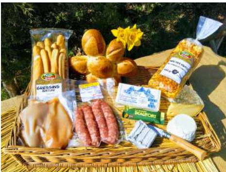
PANIER N°1 (2 personnes : 20€)

*suggestion de présentation / composition variable selon offre disponible