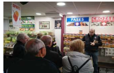
LA PASTA MAGASIN D'USINE — SAINT JEAN DE MNE