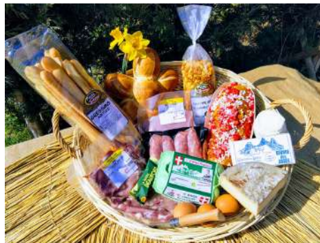
PANIER N°2 (3 à 4 personnes : 40€)