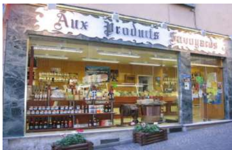
FROMAGERIE « AUX PRODUITS SAVOYARDS » — SAINT JEAN DE MNE