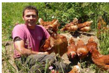
GAEC LES SI-BELLES POULETTES — ALBIEZ-MONTROND